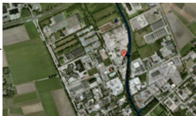
Locatie met Google Earth in beeld.